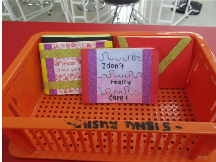
Caption : antara produk yang dihasilkan..